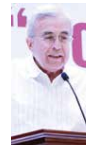
Doctor Rubén Rocha Moya, Gobernador del Estado.

implementación de políticas de desarrollo en la esfera global, nacional y regional, así como en las megaciudades como lo es la capital de nuestro país (...) tenemos el alto honor de recibir en la Universidad Autónoma de Sinaloa a la doctora Claudia Sheinbaum Pardo, una profesionista de gran capacidad intelectual y política, una mujer que ha roto paradigmas en la esfera pública, acumulando valiosas experiencias en el ramo de las políticas de gobierno”, expresó el Rector.